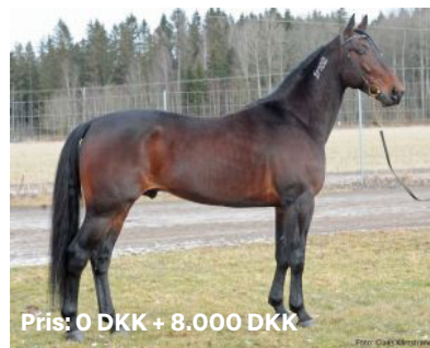
Pris: 0 DKK + 8.000 DKK